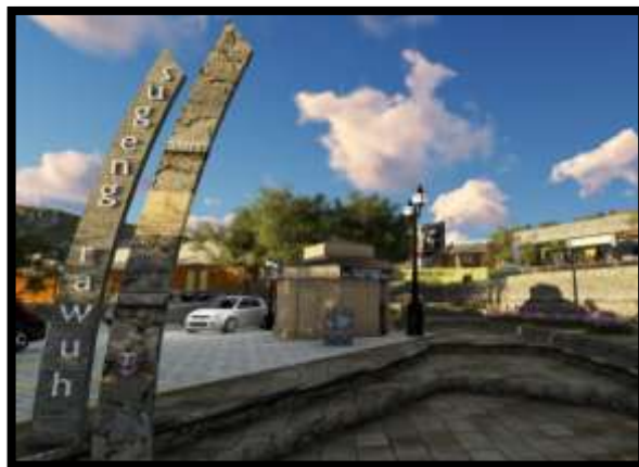
Gambar 11. Ekspresi gerbang /gapura pada area penerimaan yang dieksplorasi dari umbul-umbul

Umbul umbul juga merupakan suatu penanda bahwa terdapat suatu pusat kegiatan di dalam kampung wiata topeng Baran, Tlogowaru, Kota Malang. Keberadaan 2 buah umbul-umbul tersebut menggambarkan kesetangkupan, selain sebagai pengarah berupa batu yang diletakkan berseberangan dengan berjumlah genap dan berdiameter 20 cm menuju area selanjutnya. Tema yang diangkat pada welcome area dari kampung wisata topeng adalah nuansa tetembangan pengiring tari topeng mulai dari area gending giro yang memiliki makna awalan diikuti dengan tetabuhan yang mengiringi setiap zona yang ditata berupa orkestrasi gending-gending pengiring pertunjukan tari topeng malangan.