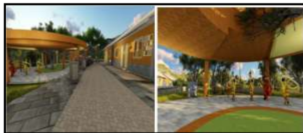
Gambar 8. Korelasi bangunan rumah warga dengan area Sanggar Tari

Area gending giro merupakan area yang pertama kali dilalui ketika memasuki kampung wisata topeng ini, di area ini pengunjung diarahkan menuju area beskalan lanang dengan menggunakan batu pengarah, di area ini pengunjung akan menemui beberapa tempat singgah sementara berupa sitting group , lalu masuk ke area jejer jawa yang memiliki fasilitas sanggar tari & workshop topeng. Sanggar tari & workshop topeng merupakan salah satu sarana tempat bertemunya masyarakat kampung topeng dengan wisatawan. Bangunan sanggar tari & workshop dirancang sebaik mungkin dengan mempertimbangkan aspek kenyamanan & keamanan penggunaannya dengan tidak mengesampingkan nuansa & suasana topeng malangan