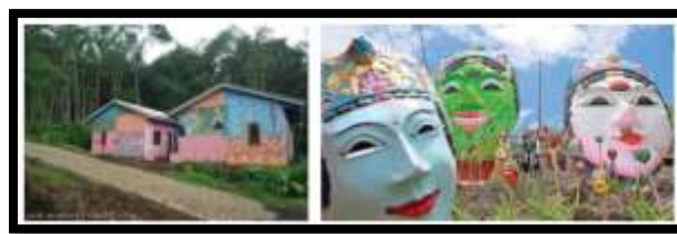
Gambar 4. Keberadaan Topeng Panji sebagai Art Work Ruang Penerima