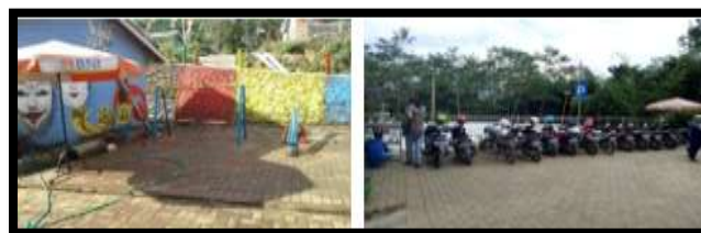
Gambar. 5. Ruang Sosial & Ruang Penerima di Kampung Wisata Topeng Beran, Tlogowaru, Kota Malang