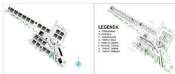
Gambar. 3. Eksisting Site Plan & Layout Plan Kampung Topeng Beran, Tlogowaru, Kota Malang

simbol yang kerap kali digunakan oleh manusia untuk menutupi atau mengekspresikan apa yang ada didalam hati mereka. Pengembangan kampung wisata diperlukan untuk membuat daya tarik masyarakat untuk mengunjungi kampung wisata, salah satu upaya yang dilakukan dengan menata area yang dianggap kurang optimal.