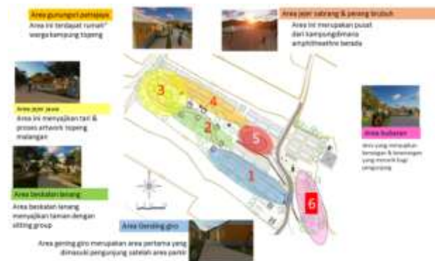
Gambar 7. Desain sequence – sequence pada setiap zona sebagai jalur interpretasi wisata

dengan penambahan 8 buah sitting group yang dirancang sebagai tempat pemberhentian sementara. Selanjutnya terdapat area sanggar tari & workshop yang terletak di ujung tapak bagian barat laut.