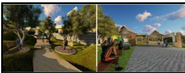
Gambar 12. Desain sequence suasana pada Area Transisi/Sitting Group dan Service Area

merupakan perwujudan maskulinitas dan femininitas yang melambangkan sifat kesetangkupan dari lambang cinta sejati oleh dua insan yang dilambangkan dengan peletakan 2 buah sitting group yang saling bersebrangan. Pada zona ini juga terdapat 8 buah sitting group dan masing masing memiliki diameter 125cm dan maknanya apabila dikali kan ( 125 \times 8 = 1000 ) maka akan mencapai 1000 yang memiliki makna kampung 1000 topeng