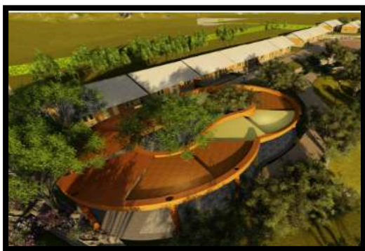
Gambar 10. Suasana Art Work Sanggar Tari & Workshop Topeng

Bagian tengah bangunan Sanggar Tari dibiarkan terbuka agar memiliki kesan lebih menyatu dengan lingkungan sekitar. Ditengah banguan yang terbuka terdapat lahan yang tidak diperkeras dengan pemberian vegetasi 2 buah pohon yang mengeskpresikan kesetangkupan yang tidak ganjil. Berlanjut ke area berkontur di bagian atas terdapat area Gunungsari Patrajaya , area ini berfungsi sebagai vantage point bagi pengunjung untuk menyaksikan view dan vista bangunan pengunjung dapat menyaksikan rumah-rumah warga kampung topeng. Berikutnya pengunjung diajak memasuki Area Jejer Sabrang & Perang Brubuh yang terletak di tengah tapak dimana area ini merupakan klimak dari rangkaian jalur wisata dengan penutup rangkaian kegiatan berada di Area Bubaran yang merupakan area service dari kampung wisata topeng ini.