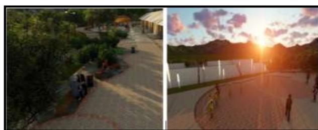
Gambar 13. Desain Area Sitting Group dan Main Area Kampung Topeng Baran Tlogowaru

Dalam area utama terdapat fasilitas sitting group & amphitheatre . Sebelum menuju area utama pola sirkulasi dibuat kontras agar terlihat bahwa seseorang akan memasuki area utama dengan mengubah bentuk linear menjadi berkelok sehingga terkesan kontras, area ini ditandai dengan area sitting group yang berjumlah dua buah yang menggambarkan kesetangkupan.