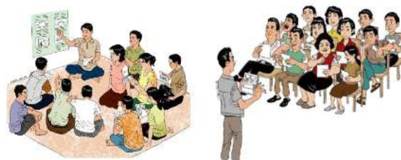
Gambar. 1. Rembug warga dilakukan untuk memperkenalkan program pengembangan kampung wisata topeng kepada masyarakat.

Perangkat kelurahan Tlogowaru, serta pihak swasta dan warga masyarakat Dusun Baran, secara bersama-sama diajak menyiapkan dan merencanakan, melaksanakan serta mengendalikan pengembangan kampung tersebut sebagai kampung wisata topeng. Dengan demikian terjadi interaksi kepentingan dan kebutuhan yang dapat tertampung dalam satu wadah. Di sini aparat Kelurahan Tlogowaru dituntut aktif melakukan sosialisasi program pengembangan kampung Topeng dan pemberdayaan masyarakat, dan juga mengajak swasta untuk ikut membantu proses dan implementasinya.