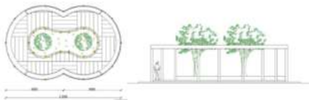
Gambar 9. Denah & Tampak Art Work Sanggar Tari & Workshop Topeng

dieksplorasi dari 2 buah lingkaran, dimana bentuk ini mengadopsi konsep kesetangkupan dari topeng malangan. Bentukkan bangunan dibuat terbuka agar pengunjung dapat melihat aktivitas di dalamnya. Desain sanggar tari & workshop topeng mengambil bentuk dasar dua buah lingkaran yang masing masing memiliki panjang 6 meter yang mengekspresikan 6 karkter utama tokoh pewayangan topeng malangan. Agar bangunan lebih terlihat kreatif maka bentuk dasar di interseksikan, sehingga memiliki bentuk yang selaras dengan jalur sirkulasi.