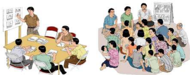
Gambar. 2. Penyusunan desain pengembangan Dusun Baran, Tlogowaru sebagai Kampung Wisata Topeng Malangan didasarkan pada hasil identifikasi serta memuat usulan-usulan kegiatan berdasarkan rembuk warga yang sudah mendapat kesepakatan dalam musyawarat desa

pendukung serta aksesibilitas, guna penentuan ruang dan fasilitas wisata di Dusun Baran. Melalui metode overlay dihasilkan zona wisata budaya topeng, dan rencana aktifitas wisata, fasilitas pendukung wisata dan jalur wisata di Dusun Baran, Kelurahan Tlogowaru, Kecamatan Kedungkandang, Kota Malang.