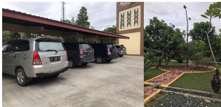
Gambar 7 Area Parkir Kendaraan