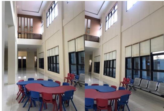
Gambar 6 Interior Autis Center

Bangunan ini tidak menimbulkan banyak sudut, selain memunculkan form follow function tadi, bangunan ini aman dari banyaknya sudut. Material lantainya tidak licin dan menggunakan karpet pada area ruangan terapi untuk memaksimalkan keamanan selama proses terapi. Kecuali pada area sekitar kolom tidak dipergunakan pelindung pada area kursial, seperti area pada gambar adalah ruang komunal dimana anak autis dapat berkumpul sebelum masuk pada ruangan terapi masing-masing. Pada area transportasi vertical juga hanya dilengkapi railing tanpa adanya karpet yang dapat mengurangi resiko dari bahaya pada anak autis.