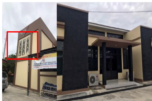
Gambar 2 Tampak Luar Autis Center