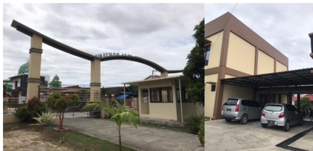
Gambar 5 Pagar dan Dinding area Autis Center

Bangunan ini dikelilingi oleh dinding dan pagar sesuai standart dalam pembangunan fasilitas kesehatan, tidak menggunakan tekstur yang kasar yang dapat membuat anak terluka pada dinding luar sehingga merespon dengan baik sifat anak autis. Elevasi dari luar ke dalam bangunan pun hanya 15 cm. dan juga bangunan ini dilengkapi dengan satpam yang berada di area terluar site. Pada area selokan yang mengitari bangunan digunakan pelindung karena berfungsi sebagai sirkulasi pengunjung. Selain itu, sebelum menuju area gedung ditambahkan atap untuk area teras.