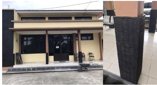
Gambar 10 Ornamen pada kolom

Pada tampilan luar bangunan, tekstur yang ditimbulkan hanyalah penghias pada area kolom bangunan. Tetapi pada dalam bangunan, tidak menggunakan tesktur lain selain dinding yang disemen dan unsur kayu dari partisi area sekitar void. Autis Center membuat tekstur yang jelas pada bangunan hingga bangunan luar. Adanya elevasi sebelum memasuki bangunan dengan material lantai, dan juga cor pada area parkir dan luar bangunan, selanjutnya rumput dan paving pada area taman ini akan melatih anak autis untuk membedakan keberadaan mereka. Apakah mereka berada di ruang dalam atau ruang luar, pemilihan teksturnya cukup jelas dan berbeda sehingga mempermudah mereka dalam membedakan tekstur.