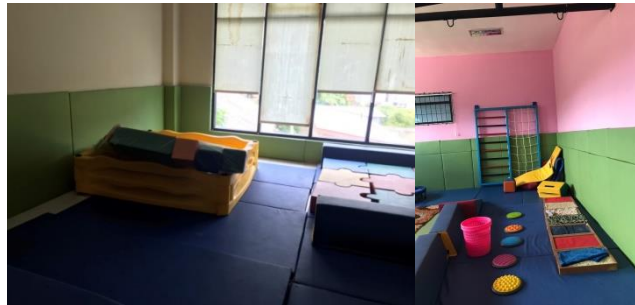
Gambar 9 Area Terapi

Faktanya, cahaya yang paling bisa diterima anak autis adalah cahaya langsung dari matahari, maka dari itu, pada area bangunan terutama area terapi mempunyai jendela yang cukup besar. Tetapi, jendela ini dilengkapi perlindungan untuk menyamarkan cahaya yang masuk berumpama untuk mengurangi distraksi pada saat proses terapi di dalam ruangan. Karena, anak autis mempunyai sifat mudah terdistract yang akan membuat proses terapi mereka tidak maksimal.