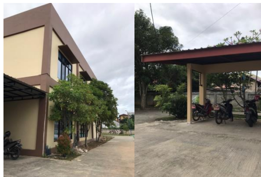
Gambar 8 Pohon sekitar bangunan

Pada perlindungan dari luar sekitar site dikelilingi oleh pohon yang dapat mengurangi intensitas cahaya yang masuk dan juga meredamkan dan mengurangi panas yang akan masuk ke dalam bangunan, sehingga dapat membantu selama proses terapi para pasien.