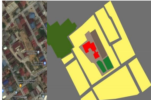
Gambar 1 Lokasi Autis Center di Bontang

Pada bagian hasil analisis akan dikelompokkan menjadi dua yaitu eksterior dan interior. Eksterior akan menganalisa secara luar bangunan yang ada di Autis Center mulai dari bentuk, fungsi, warna, tekstur dsb. Pada bagian interior akan memaparkan analisa bagian dalam bangunan. Sebelum menuju pembahasan, penulis akan memaparkan keterangan mengenai bangunan Autis Center ini.