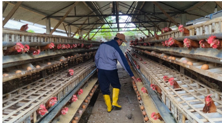
Gambar 2. Peternakan Jatinom Blitar

Metode umum atau biasa tidak dapat menangani kerumitan dan perubahan yang tidak bisa diprediksi dalam peternakan ini [9]. LSTM merupakan salah satu artificial neural network atau jaringan saraf tiruan yang mengadopsi ilmu biologi lalu ditiru cara kerjanya melalui computing [10]. LSTM dapat digunakan untuk memodelkan sequence data time series dan mampu mempertahankan informasi dalam waktu lama dan menghindari terjadinya vanishing gradient saat menangani data yang memiliki hubungan jangka panjang[11]. Peneliti menerapkan LSTM untuk memprediksi tingkat kematian ayam petelur terhadap perubahan cuaca.