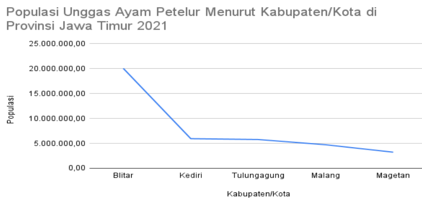
Gambar 1. Populasi Unggas Ayam Petelur Provinsi Jawa Timur Tahun 2021

Menurut Badan Pusat Statistik (BPS) pada Gambar 1 terdapat 3 Kabupaten Blitar menjadi sentra produsen telur ayam terbesar di Jawa Timur dengan hasil produksi telur sebesar 152.071,82 ton pada tahun 2023. Kecamatan Ponggok menjadi kecamatan produsen telur terbesar yang memiliki 19,4% dari total hasil produksi telur di Kabupaten Blitar serta populasi ayam petelur sebanyak 3.118.415 ekor [3]. Tingginya produksi dan populasi ayam petelur menunjukkan peran penting Kabupaten Blitar dalam ketahanan pangan, khususnya di sektor peternakan ayam petelur.