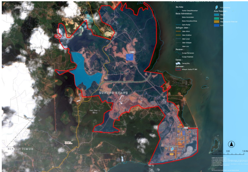
Gambar 1. Peta Indikatif Alternatif Lokasi

Dari gambar peta indikatif KEK Galang Batang di atas, terdapat luas area yang tersedia untuk pengembangan PLTS dengan rincian sebagai berikut: