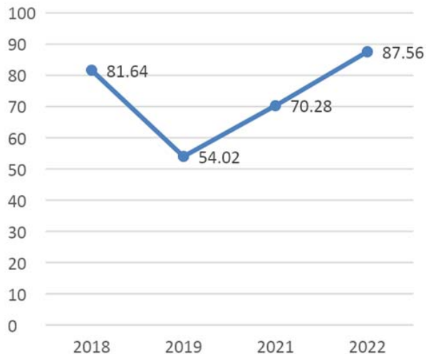
Gambar 1 Nilai Hasil Pengawasan Kearsipan BMKG Tahun 2018 - 2022 Sumber: Data Sekunder, 2023

BMKG tahun 2021 dan 2022 sebesar 81 dan 90, sedangkan nilai yang dicapai BMKG 70,28 pada tahun 2021 dan 87,56 pada 2022.