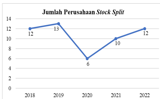
Gambar 1. Perusahaan yang Melakukan Stock Split Tahun 2018-2022