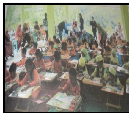
Gambar. 13. Pelaksanaan lomba mewarna