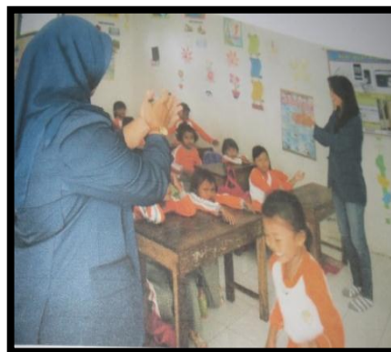
Gambar 12. penjelasan tentang lomba

Anak-anak merupakan asset Negara, sehingga perlu untuk mendapat pemberdayaan juga, cara mudah memberdayakan anak-anak adalah memberikan kegiatan sesuai dengan kemampuan fisik dan kecerdasan mereka, salah satu cara memberdayakan anak-anak adalah dengan mengikutkan mereka dalam kegiatan lomba mewarna. Dengan adanya lomba ini akan merangsang mereka untuk kreatif dan bersaing sehat.