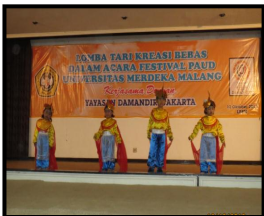
Gambar 5. Peserta lomba Tari Kupu-Kupu

Sehat, bahagia dan sejahtera merupakan idaman setiap keluarga. Dengan kondisi ini kemakmuran keluarga akan tercapai, tim bersama posdaya memberikan sumbangan makanan bergizi untuk meningkatkan kesehatan bagi keluarga, dimana sasaran program adalah kesehatan anak. Adanya program ini mendapat sambutan baik dari para kader kesehatan karena dengan pemberian dana ini maka akan menambah asupan gizi bagi warga yang kurang mampu. Untuk tambahan gizi bagi balita ini dikelola oleh posyandu dibantu tim dan beberapa mahasiswa sebagai relawan, Tambahan gizi yang dilakukan dengan memberikan kacang hijau, sayur sup dan sebagian susu balita.