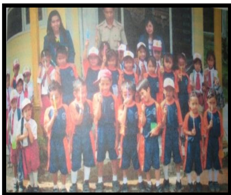
Gambar 11. Praktek sikat Gigi kelas 1-2