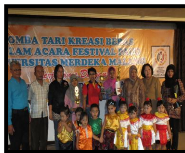
Gambar 7. Pemenang lomba dalam vestival PAUD

Kegiatan ini mendapat apresiasi dari para orang tua/wali murid PAUD, hal ini bisa dilihat dari antusiasme orang tua yang mengikuti/mengantar anaknya untuk lomba tari. Dari 14 PAUD yang mengikuti lomba tari, sebagai juara pertama adalah Pos PAUD Ade Irma suryani Kel Rampil Celaket (dengan nomor peserta 12), Juara kedua Pos PAUD Tunas bangsa Kel Sukun (dengan nomor peserta 2), dan Juara 3 Pos PAUD Melati Kel Klojen (dengan nomor peserta 5)