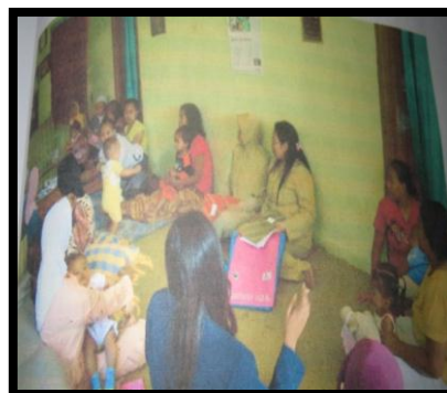
Gambar 8. Penjelasan tim kepada ibu pengelola posyandu