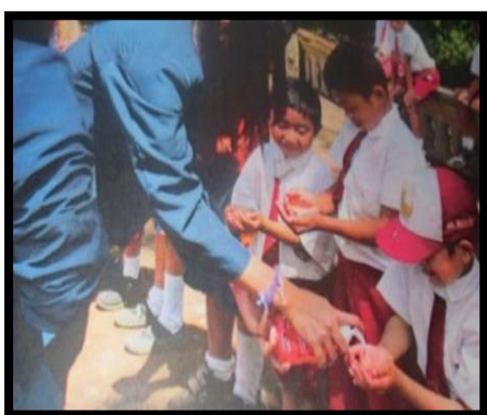
Gambar 10. Praktek cuci tangan siswa kelas 1-2

Salah satu kegiatan penyuluhan kesehatan yang dilakukan tim bersama mahasiswa adalah memberikan penyuluhan kebersihan diri dan kebersihan gigi bagi murid SD kelas satu dan kelas dua. Dengan penyuluhan ini murid SD yang semula tidak peduli untuk selalu membersihkan tangan mereka ketika mau makan, dan malas untuk menyikat gigi, setelah acara ini mereka rajin membersihkan tangan mereka dan menyikat gigi dengan baik dan benar sehingga kesehatan mereka terjaga.