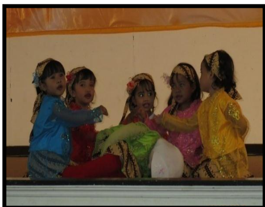
Gambar 6. Peserta lomba tari cublak-cublak suweng