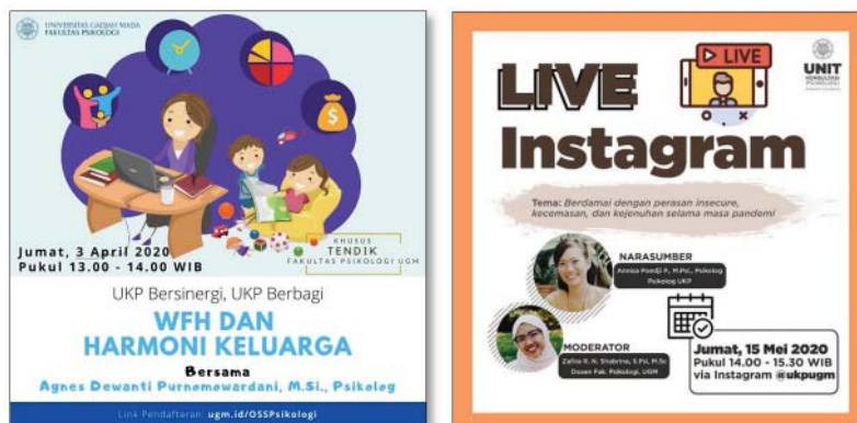
Gambar 1. Poster Publikasi UKP Bersinergi UKP Berbagi 1 Gambar 2. Poster Publikasi untuk UKP Bersinergi UKP Berbagi

Tiga bulan pasca pandemi COVID-19 merebak di Indonesia, dampak dan perubahan hidup yang besar mulai disertai dengan ketidakpastian kapan berakhirnya masa tersebut. Akibatnya, tema kecemasan dan insecurity menjadi isu utama yang mengancam kesehatan mental sebagian besar masyarakat di berbagai kalangan. Di samping munculnya rasa insecure , adanya pembatasan sosial yang mengharuskan untuk SFH dan WFH secara berkepanjangan pun mulai mendorong individu merasa jenuh. Berangkat dari permasalahan ini, tema dukungan psikologis selanjutnya yang diangkat adalah berdamai dengan perasaan insecure , kecemasan dan kejenuhan selama masa pandemi. Publikasi dilakukan melalui media sosial seperti yang ditunjukkan dalam Gambar 2.