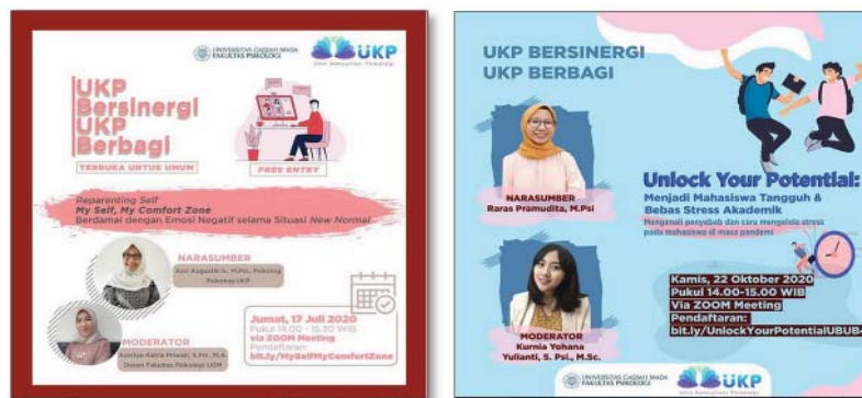
Gambar 3. Poster Kegiatan UKP Bersinergi UKP Berbagi 3 Gambar 4. Poster Kegiatan UKP Bersinergi UKP Berbagi 4

Melalui UBUB ke-4 ini peserta diajak untuk mengenali dan memahami diri sendiri agar dapat membuka potensi untuk bertahan menghadapi tantangan era pandemi COVID-19. Kemampuan untuk mengenali dan memahami potensi diri ini akan memudahkan mahasiswa untuk membangun model atau gaya belajar yang sesuai kebutuhannya, yang mengintegrasikan kebutuhan pribadi sebagai manusia dengan peran penggunaan teknologi, serta menemukan solusi yang efektif untuk meraih impiannya. Peserta juga diajak untuk mengelola stres akademik dengan cara mengenali kapasitas dan kemampuan diri, menyadari situasi sulit tidak selamanya, kemudian memilah hal-hal yang bisa dikendalikan dan hal-hal yang tidak dapat dikendalikan, menguatkan kondisi psikologis pribadi melalui kegiatan self-care (merawat diri) dan fokus pada optimalisasi potensi. Informasi mengenai acara UBUB ini dibagikan kepada masyarakat umum melalui sosial media, dengan poster seperti yang tertera pada Gambar 4.