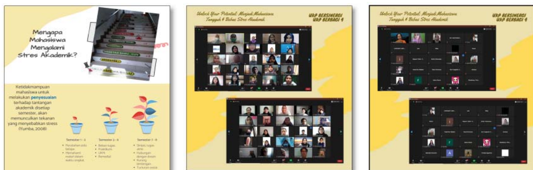
Gambar 8. Dokumentasi Kegiatan UKP Bersinergi UKP Berbagi 4

kasus terkonfirmasi positif COVID-19 pun menyebabkan kegiatan tetap harus dilaksanakan secara daring. Proses pembelajaran daring ini tentu bukan hanya membuat mahasiswa untuk menyesuaikan diri dengan perubahan metode dan memberdayakan hal-hal yang berkaitan dengan teknologi guna menunjang pembelajaran daring, namun juga terkait membangun komunikasi dan relasi sosial secara jarak jauh. Beberapa jurnal penelitian juga menemukan bahwa stres akademik yang semakin meningkat selama pembelajaran daring ( school from home ) berdampak pada penurunan performa mahasiswa dan kesulitan dalam penemuan strategi koping yang efektif (Lubis, Ramadhani, & Rasyid, 2021; Wang & Zhao, 2020; Watnaya, Muiz, Sumarni, Mansyur, & Zaqiah, 2020; Agustiningasih, 2019). Oleh karena itu, topik tentang mengelola stres akademik di era pandemi menjadi isu penting untuk diangkat menjadi tema UBUB 4. Selain memberikan dukungan psikologis, UBUB 4 juga dapat memberikan psikoedukasi kepada mahasiswa agar lebih siap mental dalam menjalani perkuliahan berbasis daring di era pandemi COVID-19. Efektivitas kegiatan UBUB 4 ini tampak ketika mahasiswa menjadi lebih mampu memahami kondisi psikologisnya dan menemukan potensi yang ada di dalam dirinya untuk dikembangkan pasca acara. Lebih lanjut, peserta mampu menunjukkan mental yang lebih tangguh setelah menemukan insight untuk mengatasi tekanan psikologisnya, lebih semangat dalam menjalani perkuliahan, dan mampu menemukan strategi pemecahan masalah yang efektif.