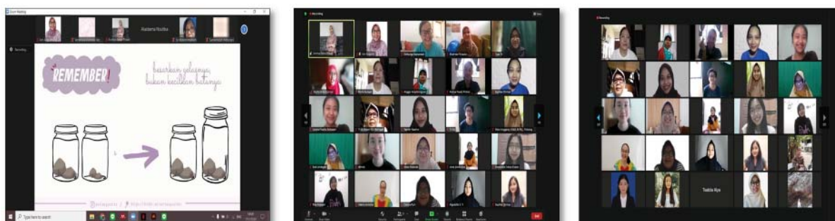
Gambar 7. Dokumentasi Kegiatan UKP Bersinergi UKP Berbagi 3

UBUB ke-3 diselenggarakan ketika masyarakat memasuki era new normal , yaitu situasi yang “memaksa” individu untuk kembali berada dalam situasi yang tidak nyaman (menjalankan semua aktivitas dengan banyak aturan dan pembatasan yang ketat). Situasi seperti ini rentan memicu munculnya luka batin pada inner child seseorang ketika menjalani masa pengasuhan (James, 1974). Pemilihan topik tentang reparenting menjadi tepat sasaran karena sebagian besar masyarakat membutuhkan proses berdamai dengan emosi negatif yang di- trigger oleh situasi selama masa pandemi COVID-19. Antusiasme dan diskusi tanpa henti mewarnai proses psikoedukasi ini. Melalui kegiatan ini (lihat Gambar 7), efektivitas dari psikoedukasi dan dukungan psikologis yang diberikan terlihat saat peserta mampu memahami emosi, serta mengaplikasikan tahapan reparenting self untuk berdamai dengan luka batin semasa inner child yang terpicu muncul kembali selama pandemi COVID-19.