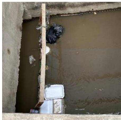
Gambar 5. Penyaringan Sampah Di Saluran Air

Dengan terus dilakukannya peningkatan dan perbaikan terhadap infrastruktur, artinya pengelola memperhatikan dan berusaha memenuhi kebutuhan wisatawan, juga masyarakat. Salah satu bentuk upaya yang dilakukan untuk mengurangi dampak menurunnya kualitas dari infrastruktur di pelabuhan, pihak pengelola membuat dan memasang sistem penyaringan sampah di saluran air. Sayangnya, tindakan ini belum terimplementasikan secara merata di seluruh titik saluran air di Pelabuhan Sunda Kelapa seperti pada gambar 5. Ketika sampah-sampah sudah tersaring, maka petugas kebersihan akan mengambil dan membersihkan saluran agar tidak menyebabkan penyumbatan.