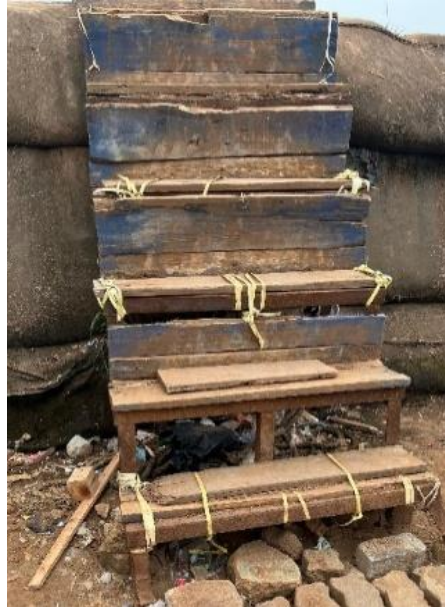
Gambar 4. Tangga Akses Menaiki Tanggul

jalur pedestrian yang dapat mengganggu aktivitas wisatawan. Infrastruktur di Pelabuhan Sunda Kelapa menunjukkan bahwa memang masih terdapat kekurangan terkait kondisi jalan, saluran air, jalur pedestrian, serta aksesibilitas. Masih terdapat beberapa jalan yang kondisinya rusak dan berlubang akibat sering dilewati kendaraan bermuatan berat. Kemudian di beberapa titik saluran air, ditemukan adanya sampah yang mengapung. Jalur pedestrian berupa trotoar juga terlihat hancur di beberapa bagian. Lalu, aksesibilitas bagi wisatawan untuk berkeliling pelabuhan terhambat oleh adanya banjir rob yang menghalangi. Sayangnya, lokasi banjir terletak dengan dengan lokasi terparkirnya kapal-kapal pinisi. Wisatawan seharusnya dapat melihat kapal pinisi dari dekat untuk mengagumi keindahan kapal tradisional tersebut. Hanya saja, selain sulitnya akses saat banjir melanda, tangga sebagai akses untuk menaiki tanggul berada dalam kondisi yang kurang baik, sehingga wisatawan harus ekstra berhati-hati saat menaiki tangga ini. Tanggul di Pelabuhan Sunda Kelapa merupakan batas antara perairan dan daratan. Terlihat pada gambar 4, tangga yang tersedia sekaligus menjadi akses bagi wisatawan yang ingin menaiki perahu untuk berkeliling perairan.