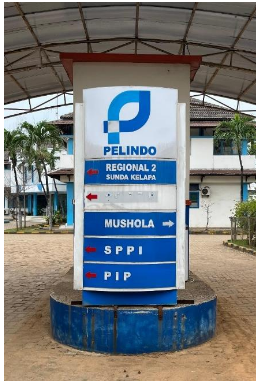
Gambar 6. Petunjuk Arah

Penyediaan fasilitas masih belum merata di Pelabuhan Sunda Kelapa. Selain berkendala pada jarak letak fasilitas, kondisi fasilitas juga cukup disayangkan. Tersedia mesin ATM yang berada di depan kantor Pelindo. Hanya saja, jumlah mesin tersebut terbatas dan masih tidak diketahui alasan pengurangan jumlah mesin yang sebelumnya terdapat 3 mesin, kini hanya tersisa 1 mesin. Kemudian, adapun toilet portable yang disediakan di depan kantor Pelindo, yang sayangnya terkunci karena tidak dapat digunakan untuk sementara akibat penyalahgunaan fungsi fasilitas. Hal ini memicu keprihatinan akibat tindakan oknum yang tidak bertanggung jawab dalam penggunaan fasilitas di Pelabuhan Sunda Kelapa. Selanjutnya terkait tempat pembuangan sampah, yang tersebar di kawasan pelabuhan bukanlah tempat sampah terpilah. Tempat sampah terpilah hanya dapat ditemukan di area kantor Pelindo. Terkait petunjuk arah yang berada dipelabuhan, fasilitas tersebut memiliki keterbatasan informasi dan hanya ditemukan di depan kantor Pelindo (Gambar 6).