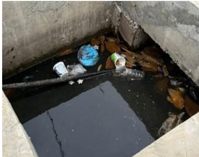
Gambar 3. Sampah di Saluran Air