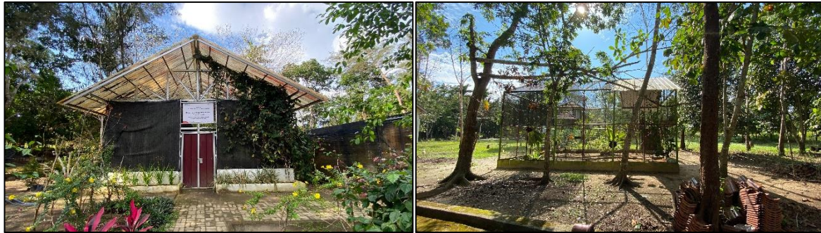
Gambar 2. Kawasan Hutan Kota Tua Tunu