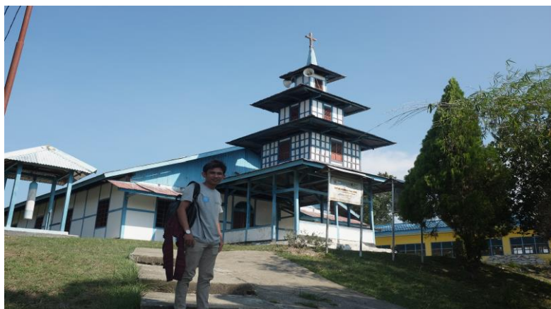
Gambar 2. Gereja GKI Philadelfia Asey Besar

Berdasarkan penelusuran peneliti, tahun peresmian Gereja Asey juga dapat dilihat di salah satu trap anak tangga teras yang terdapat di bagian depan sebelah utara. Untuk Lantai Gereja Asey terbuat dari plesteran semen, dan tidak memiliki plafond. Rangka atap disangga oleh 10 tiang kayu dengan menggunakan pasak setinggi 3,3 meter. Jumlah tiang penyangga ini melambangkan jumlah marga yang mendiami Pulau Asey (ohee, Ongge, Pepoho, Asabo, Nere, Puhiri, Pouw, Kere, Yanggo, dan Puraro). Hal tersebut diperkuat dengan hasil wawancara salah seorang masyarakat Asey Besar Santina Nere mengungkapkan bahwa ada beberapa marga yang mendiami Pulau Asey yakni marga ohee, Ongge, Pepoho, Asabo, Nere, Puhiri, Pouw, Kere, Puraro, dan Yanggo. Selain bermukim di Asey Besar juga telah tersebar hingga ke daratan Danau Sentani mulai dari Asey Kecil, Kampung Harapan, hingga ke wilayah Buper Kampung Waena Kota Jayapura.