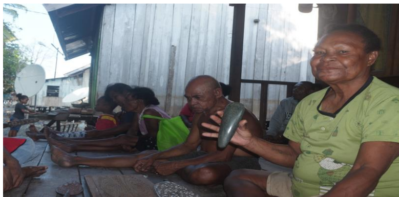
Gambar 4. Kapak Batu/ Tomako Batu Jenis Relae

Selain kapak batu, alat pembayaran lainnya berupa manik-manik yang terdiri dari tiga jenis haye , hawa , dan nokhong serta gelang yang kemudian disebut ebha . Alat-alat pembayaran tersebut masih berlaku hingga saat ini dalam melangsungkan proses pernikahan yang berfungsi sebagai mas kawin.