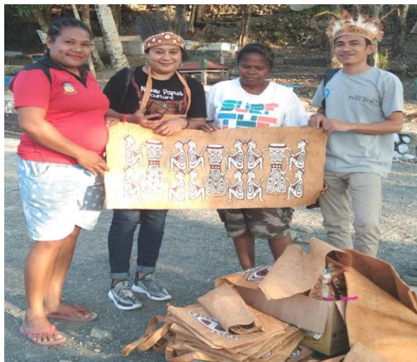
Gambar 3. Kerajinan Ukiran Kulit Khas Asey Besar

Ukiran dengan berbahan dasar kulit kayu merupakan kerajinan asli tanah Papua yang menjadi produk unggulan hasil karya masyarakat Asey. Lukisan kulit kayu ini merupakan tradisi turun temurun warisan budaya leluhur masyarakat Pulau Asey. Awalnya lukisan kulit kayu karya masyarakat Asey merupakan simbol dan peringatan tentang segala hal yang berhubungan dengan kehidupan masyarakat Asey. Perkembangan zaman yang kian modern, tradisi ini kemudian bergeser menjadi kesenian yang menawarkan nilai yang cukup tinggi. Kerajinan inipun kemudian menjadi salah satu sumber pendapatan untuk menopang ekonomi keluarga masyarakat setempat.