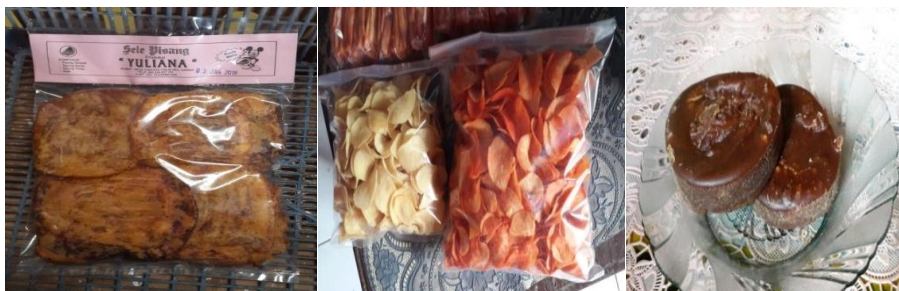
Gambar 1. Produk Pisang Sale, Kripik Singkong, Gula Aren

Hasil produksi industri rumahan lebih banyak berupa makanan kecil, seperti pisang sale, kripik singkong dan stik ubi ungu, serta makanan mentah seperti gula aren, kolang kaling dan jamur. Namun untuk penelitian ini penulis hanya memfokuskan pada tiga produk saja, yaitu pisang sale, kripik singkong dan gula aren karena ketiga produk ini yang mampu diproduksi terus menerus dan memberi kontribusi bagi kesejahteraan para perempuan walaupun masih terbatas. Sementara untuk kolang kaling dan stik ubi ungu tidak dapat diproduksi terus menerus karena langkanya bahan mentah yang diperlukan, dan industri jamur dimiliki dan dikelola oleh laki-laki yang bukan merupakan obyek penelitian.