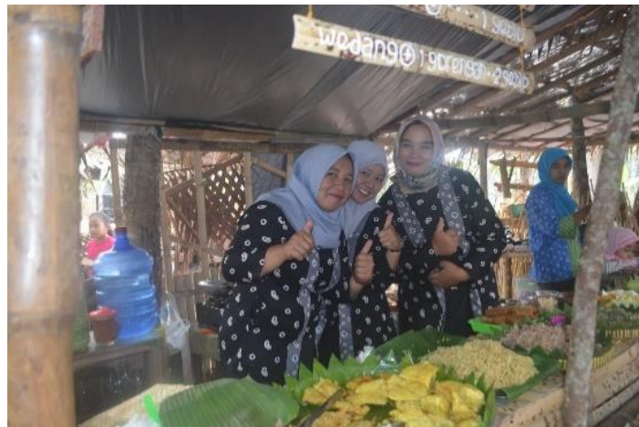
Gambar 2. Pelapak dengan pakaian tradisional

Prinsip ini meliputi keunikan karakter budaya, interaksi pertukaran budaya, dan penghormatan terhadap perbedaan budaya dan martabat. Dalam hal ini masyarakat Desa Salam berusaha untuk melestarikan budaya agar tetap hidup sebagai jati diri masyarakat. Dalam setiap penyelenggaraan Pasar Gemblung, pengelola mengenakan pakaian tradisional, yang pria memakai sorjan dan blangkon, sedangkan yang perempuan mengenakan kebaya dan jarit . Disamping itu ditampilkan pula kesenian tradisional seperti tari topeng ireng dan pertunjukan gamelan ataupun angklung oleh warga Desa Salam sendiri. Informan Bapak Sunarto (bendahara Pasar Gemblung) menerangkan, bahwa karena sudah menjadi komitmen untuk meramaikan pasar tradisional, maka apapun yang ditampilkan dalam pasar harus menonjolkan sisi tradisionalnya.