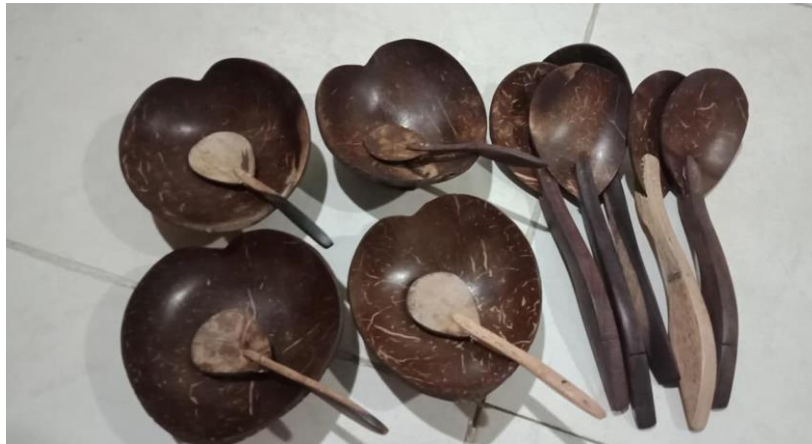
Gambar 3. Bathok untuk menyajikan makanan tradisional

penyajian dinyatakan, bahwa makanan harus disajikan secara tradisional dengan daun pisang ataupun bathok . Kemudian setiap malam sehabis penyelenggaraan pasar, masyarakat desa bersama-sama membersihkan lahan terutama di musim kemarau untuk menyiram lahan agar tidak banyak debu.