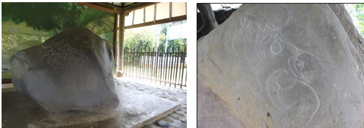
a Gambar 2. a) Situs Batu Ciaruteun, b) Situs Pasir Awi

Berdasarkan bentuknya, mayoritas benda cagar budaya tersebut adalah prasasti (51,72 %). Dari benda cagar budaya tersebut terdapat prasasti abad ke 5 peninggalan Kerajaan Tarumanegara yang merupakan prasasti kedua tertua di Indonesia diantaranya: prasasti ciaruteun, kolengkak/jambu, kebon kopi, yang di simpan di Museum Nasional Jakarta karena di Kabupaten Bogor belum memiliki lokasi khusus untuk penyimpanan benda purbakala atau warisan budaya. Berdasarkan klasifikasi benda cagar budaya berdasarkan mayoritas cagar budaya yang ada di Kabupaten Bogor termasuk dalam benda cagar budaya (Tabel 2). Namun demikian, terdapat empat objek yang belum masuk kategori benda cagar budaya. Objek-objek tersebut dapat diusulkan sebagai cagar budaya. Kementerian Pendidikan dan Kebudayaan (2019) menyatakan bahwa bangunan, benda,