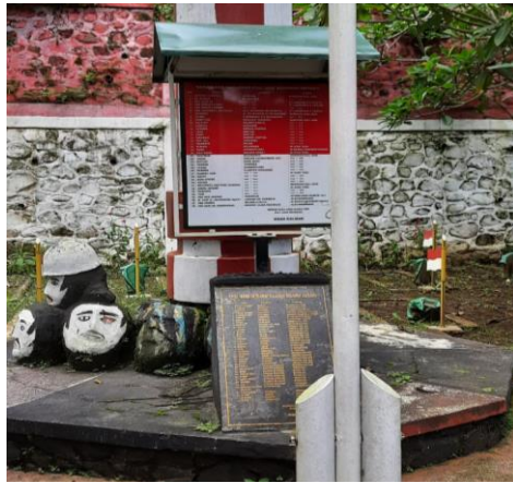
Gambar 3 : Makam Pejuang Coban Jahe

Berdasarkan hasil Wawancara terdapat sedikit sejarah yang dijelaskan oleh pengelola Coban Jahe yakni Coban Jahe sendiri diambil kata dalam bahasa jawa 'pejahe' yang berarti meninggal dunianya. Nama itu diambil untuk mengenang 38 pejuang gerilyawan kemerdekaan yang gugur saat pertempuran dengan tentara sekutu di hutan. Nama itu pula yang disematkan ke sungai kecil yang menjadi aliran ke air terjun. Kala itu 38 gerilyawan tengah beristirahat sambil menata strategi untuk melawan tentara sekutu, namun karena ada seseorang yang memberitahukan ke Belanda mengenai pergerakan gerilyawan, akhirnya mereka diserang.