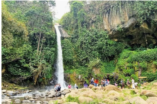
Gambar 1 : Wisata Coban Jahe

Penelitian ini dilakukan selama kurang lebih 1 bulan yakni pada bulan Oktober – November 2021. Penelitian dilakukan tepatnya pada Wisata Coban Jahe, Jabung, Kabupaten Malang. Objek wisata air terjun itu berlokasi di Dusun Begawan, Desa Pandansari Lor, Kecamatan Jabung, Provinsi Jawa Timur. Lokasinya berjarak sekitar 30 kilometer ke arah timur, dekat pintu masuk kawasan Taman Nasional Bromo Tengger Semeru. Secara spesifik, lokasi Coban Jahe berada dalam kawasan hutan produksi kepunyaan Perhutani Unit II Jawa Timur Kesatuan Pemangkuan Hutan (KPH) Malang, yang secara teknis dalam kewenangan pengelolaan oleh Resor Pemangkuan Hutan (RPH) Sukopuro, Kecamatan Jabung.