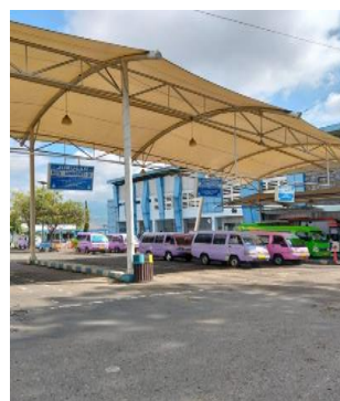
Gambar 1. Kondisi Eksisting Angkutan Umum di Terminal Batu