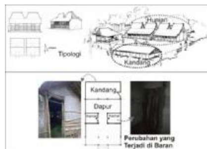
Gambar 5 : Perubahan Pada Denah Pada Hunian

Sementara itu, dilihat dari denahnya, jika dibandingkan dengan tipologinya, terdapat perubahan, pada bangunan yang masih memiliki bentuk arsitektur vernakular Madura. Yaitu letak kandang yang ada di bagian belakang rumah, dan adanya tambahan sekat untuk ruang kamar.