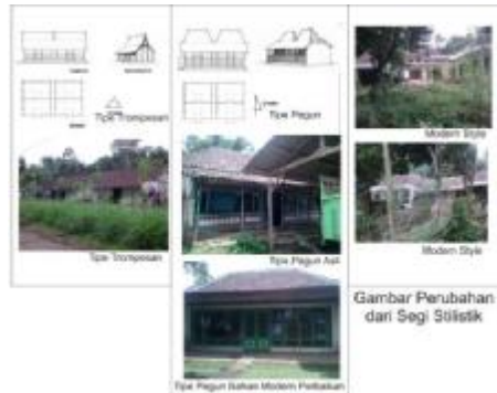
Gambar 4 : Hasil Analisa Perubahan Gaya Bangunan

anggota keluarga yang menjadi TKI, perekonomian meningkat, dan rona lingkungan mulai berubah dengan adanya perubahan gaya bangunan.