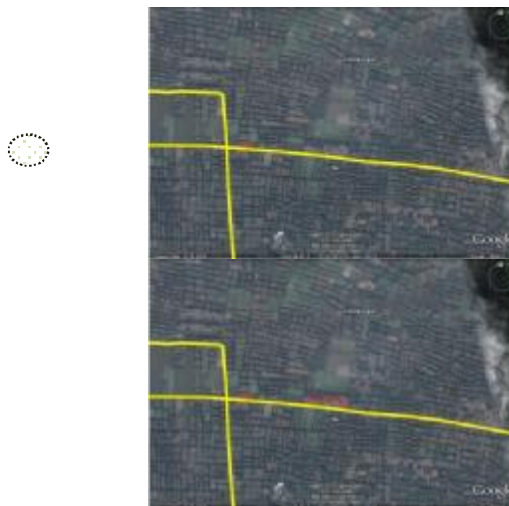
Gambar 1 : Tahap Awal Kluster Pemukiman di Desa Baran Kidal Malang

Pada dasarnya perkembangan pemukiman berkembang dengan seiring perkembangan zaman, karena adanya kebutuhan akan tempat berhuni yang baru. Pola persebarannya bisa dilihat melalui adanya kecenderungan adanya jalan baru yang selanjutnya diikuti dengan adanya perbaikan jalan pada jalan yang sebelumnya jalan tanah tersebut, dan muncul pemukiman baru. Seperti yang dapat dilihat dari hasil analisa di bawah ini.