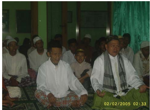
Perayaan Maulid Nabi di Kampung Sanan

Dan karakteristik yang terakhir adalah religius. Religius adalah salah satu karakteristik masyarakat di Kampung Sanan yang dapat mempengaruhi sebagian besar kehidupan di dalamnya. Dengan mayoritas penduduk adalah penganut Islam, nilai-nilai agama juga menjadi pengiring kehidupan dalam masyarakatnya. Menurut keterangan informan, sering diadakan pengajian, ceramah, atau selamatan sebagai bentuk rasa syukur kepada Tuhan Yang Maha Esa, di lingkungan Kampung Sanan sendiri. Karakteristik masyarakatnya yang menjunjung tinggi nilai-nilai agama dan kekeluargaan juga mempengaruhi bisnis yang ada. Dengan kepercayaan, "Rezeki itu di tangan Tuhan, kalau mau berusaha pasti ada jalan." Menjadi pendorong masyarakatnya untuk terus berproduksi.