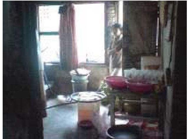
Fasade dan ruang Kerja Hunian Pembuat Tempe dan Keripik Tempe