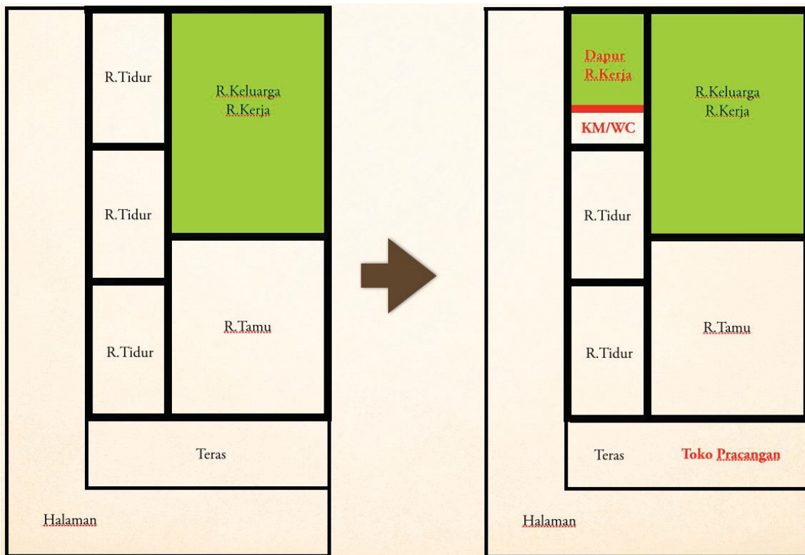
Denah Perubahan Ruang Hunian Pembuat Keripik Tempe