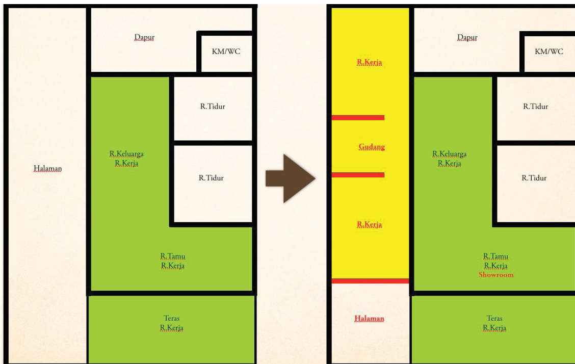
Denah Perubahan Ruang Hunian Pembuat Tempe dan Keripik Tempe