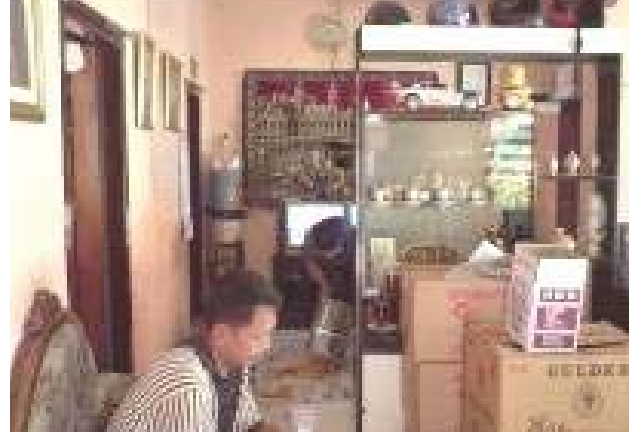
Fasade dan ruang Kerja Hunian Pembuat Tempe, Keripik Tempe dan Membuka Showroom