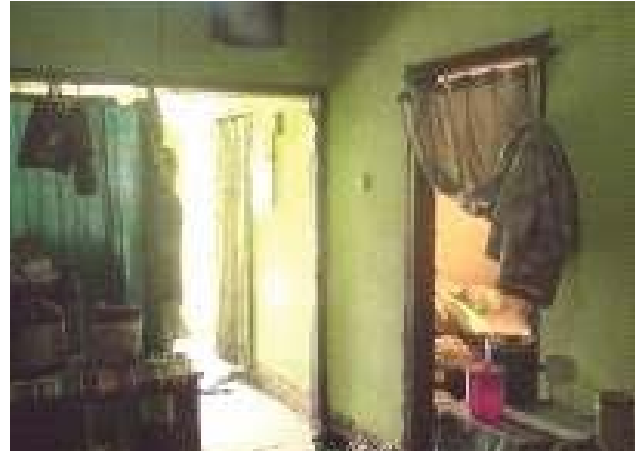
Fasade dan ruang Kerja Hunian Pembuat Keripik Tempe