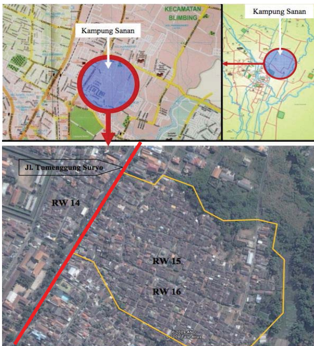
Citra Satelit Kampung Sanan