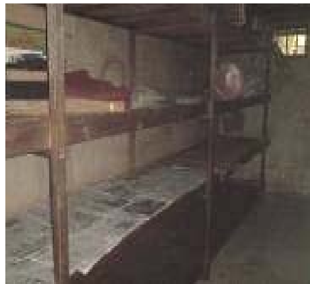
Fasade dan ruang Kerja Hunian Pembuat Tempe