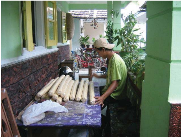
Proses Pembuatan Tempe