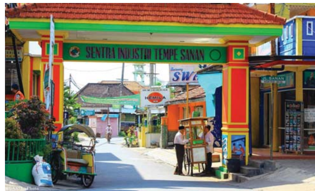
Gerbang masuk Kampung Sanan

Pada awalnya, Kampung Sanan (baik RW 14, RW 15 dan RW 16 merupakan satu wilayah yang utuh namun sejak dibangunnya Jalan Tumenggung Suryo (dibuat untuk memudahkan jalur transportasi dari Surabaya sampai ke pusat Kota Malang) yang membelah kampung ini sehingga ketiga RW tersebut terpisah dimana RW 14 di sebelah barat dan RW 15 serta RW 16 berada di sebelah timur Jalan Tumenggung Suryo.