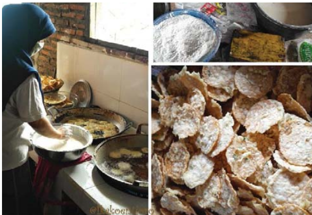
Proses Pembuatan Keripik Tempe