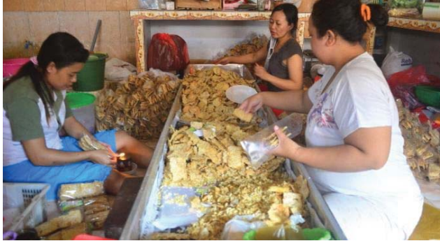
Gotong Royong Mengemas Keripik Tempe

Karakteristik selanjutnya adalah rasa rendah hati dan terbuka, dengan serta merta, penduduk di Kampung Sanan selalu terbuka menerima pengunjung dengan kerendahan hati yang membuat kesan ramah juga terasa dalam interaksinya. Mungkin dikarenakan pengunjung adalah berkah bagi mereka yang dapat membantu berkembangnya usaha mereka. Dapat dikatakan masyarakat di Sanan terbuka akan masukan dan mereka sadar bahwa perubahan akan memberikan efek bagi kehidupan maupun bisnis mereka.