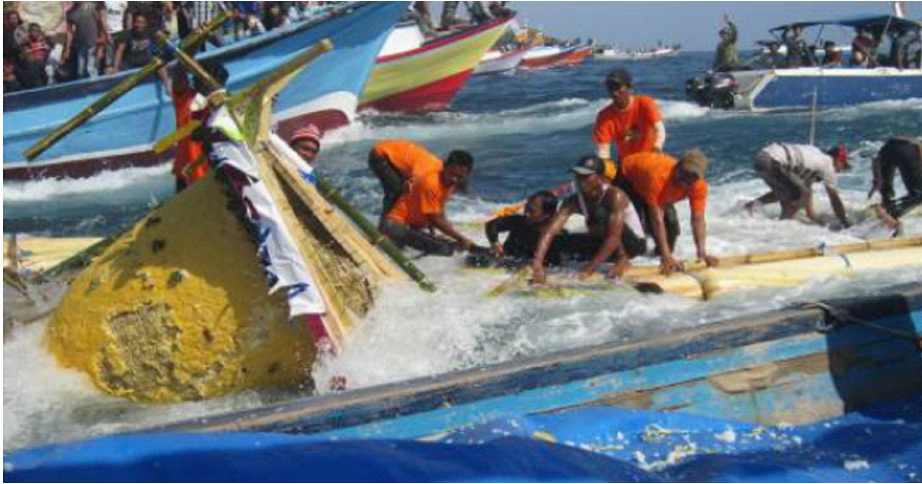
Gambar 4. Prosesi larung sesaji dalam ritual petik laut