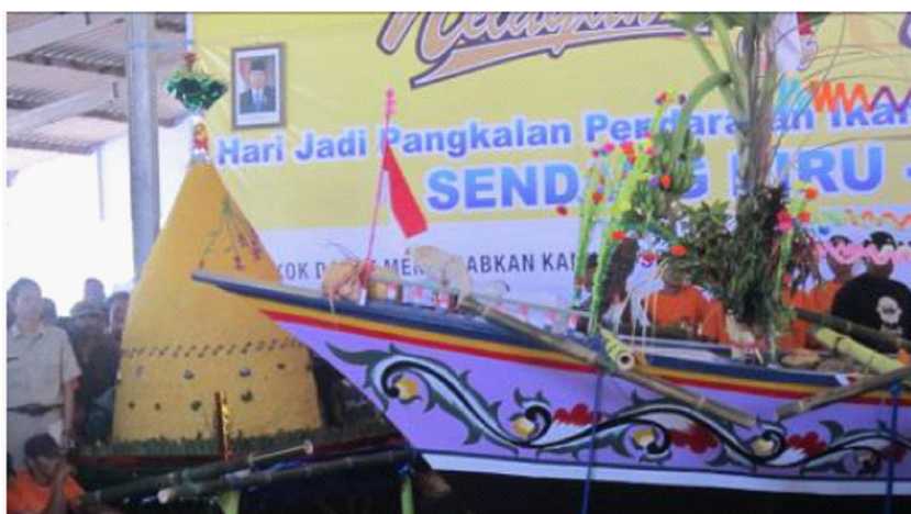
Gambar 3. Gunung sesaji ritual petik laut