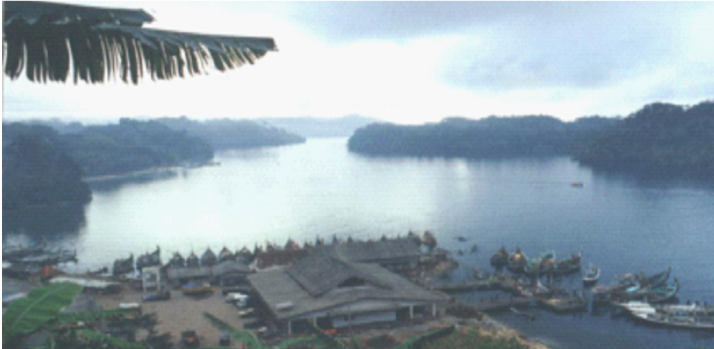
Gambar 2. Letak lokasi Pantai Sendang Biru dan Pulau Sempu.

Secara geografis daerah Sendang Biru terbagi atas daerah perbukitan dan pantai yang membagi penduduknya menjadi: