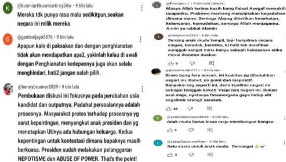
Gambar 2 Tangkapan Layar Komentar Youtube

Banyak komentar yang menyatakan dukungan bagi kaum muda untuk terjun ke politik dan berpartisipasi aktif dalam politik dan pemerintahan, banyak pula masyarakat yang mengkritik putusan MK tersebut berdasarkan proses pengambilan keputusan yang dinilai memiliki banyak kejanggalan seperti yang dijelaskan beberapa partisipan sepanjang diskusi berlangsung. Hal ini menunjukkan adanya kesepahaman antara masyarakat dengan partisipan baik dari pihak pro, maupun kontra, di mana masyarakat sebagian masyarakat mendukung, menolak, dan sebagian lagi berpendapat netral dengan tidak mempermasalahkan hasil sidang putusan perkara yang menggugat UU pasal 169 huruf q mengenai batasan usia capres-cawapres tersebut, tetapi masyarakat lebih mempermasalahkan proses di balik pengambilan putusan tersebut.