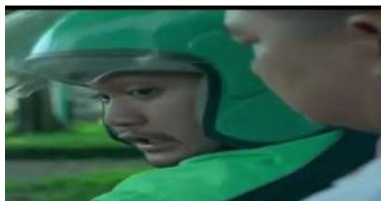
Gambar 9. Driver Ojek online berbalik memarahi Caleg karena minta cepat

Signifier dalam video kali ini adalah soal kecepatan dan pekerjaan. Zaman ini menuntut adanya kecepatan yang menjadi ciri dari kemajuan (Piliang, 2011:83). Kecepatan saat ini salah satunya ditandai dengan hadirnya ojek online yang saat ini pasar Indonesia dikuasai oleh Go-Jek dan Grab. Caleg dalam video tersebut menggunakan jasa Grab untuk berpindah dari tempatnya menunggu ke lokasi kampanye. Agendanya, dia harus cepat sampai agar bisa berbicara di depan massa untuk memilihnya.