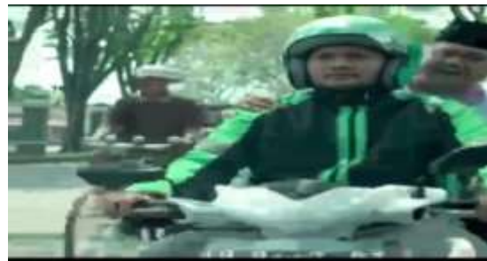
Gambar 8. Caleg dibonceng oleh ojek online dan didahului oleh sepeda ontel

Driver: Cepat-cepat, emang bapak bikin undang-undang bisa cepat?