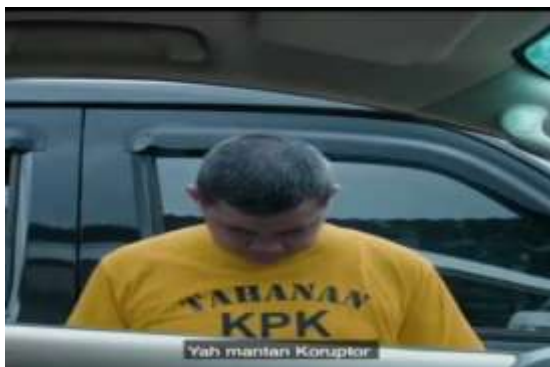
Gambar 3. Ketika kaca jendela dibuka ternyata yang muncul adalah lelaki yang

Gambar tersebut merupakan adegan video berjudul “Tampang Caleg” yang berdurasi 20 detik. Gambar pada scene 1 menunjukkan seorang calon legislatif tersenyum sambil berkaca di samping mobil. Calon legislatif tersebut menggunakan jas dan dasi yang menyimbolkan kaum kaya, pebisnis dan berkelas, lalu peci yang memberi symbol ke-Indonesia-an yang digagas oleh Soekarno (Nordholt, 2005:102) dan pin di dada kiri menunjukkan identitas dirinya sebagai Calon Anggota Legislatif RI.