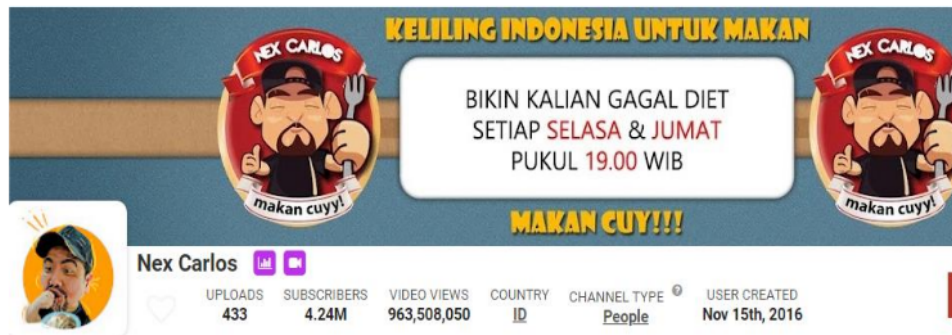
Gambar 1. : Profil Channel Youtube Nex Carlos

Nex Carlos merupakan food vlogger ternama nasional. Lokadata.Id (2021) menempatkannya pada peringkat ketiga dari sepuluh food vlogger Indonesia. Wajar gelar tersebut disematkan kepadanya sebab ia memiliki 4.24 juta subscriber dan total 433 video yang sudah diunggah. Socialblade.com (2021) mencatat akun yang dibuat 15 Nopember 2015 sudah ditonton 963.508.050 kali. Lewat motto “Makan Cuy !” plus deskripsi “Hi, nama gw Nex dan gw suka makan! Jadi gw keliling Indonesia buat makan dan mencoba makanan khas di setiap daerah”, Carlos dapat disebut sebagai pecinta kuliner lokal Nusantara. Berwisata keliling daerah Indonesia sambil mengulas dan mencicipi masakan khas masing-masing daerah menjadi brand pribadinya sekaligus menjadi daya tarik untuk dilanggan dan ditonton. Tidak heran jika setiap konten video yang diunggahnya ditonton kurang lebih dari 1 juta kali penayangan. Salah satu video unggahannya bertajuk “Cuma Nasi Sama Telor Tapi yang Makan Rame !!!” yang dibuat 27 Pebruari 2018 sempat viral dengan total jumlah tayangan mencapai 16 juta kali (Nex Carlos, 2018). Caranya mengulas masakan secara apa adanya tanpa terkesan melebih-lebihkan merupakan penciri dan jati dirinya. Keunikannya yang lain adalah memberikan tanda “Gak ada obat” saat mencicipi masakan. Ini melambangkan bahwa kuliner tersebut merupakan kuliner paling enak yang pernah dicicipinya.