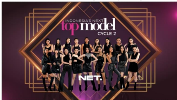
Gambar 1 Finalis Indonesia Next top Model Cycle 2

Model-model dari seluruh provinsi di Indonesia datang ke sebuah rumah karantina untuk di tempa menjadi seorang top model dengan jumlah model yang berjuang dan masuk yaitu 18 perempuan berbakat, yang berhasil melewati serangkaian seleksi dari ribuan model cantik. Sebuah teknik dalam setiap pose diberikan bimbingan dan arahan oleh pembawa acara sekaligus juri di INTM Cycle 2 yaitu Panca Makmun dan Luna Maya yang senantiasa mengarahkan pose pada saat photoshoot challenge dan runaway . Kemudian ada pula yang menjadi mentor sekaligus juri yakni Ivan Gunawan dan Ayu Gani. Para model merebutkan uang ratusan juta rupiah yang bisa dibawa pula dan mendapat title sebagai juara 1 Indonesia Next Top Model (INTM) Cycle 2 dengan perusahaan yang bekerja sama yaitu Net Mediatama Televisi (NET) dan Samsung Galaxy Z Flip 3 5G.