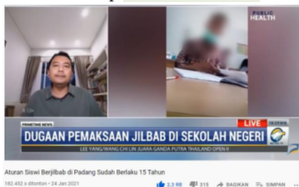
Gambar 3: Capture video viral di SMKN 2 Padang yang menyertakan pembicaraan narasumber.

Ada beberapa elemen yang diamati pada struktur retorisi ini, yakni grafis dan metafora dalam video Metro TV. Misalnya pada unsur grafis diawali dengan narasi “bila sifatnya hanya imbauan mengapa peraturan tentang siswi non-muslim harus mengenakan jilbab di Kota Padang bisa ada? Kami akan mengulasnya bersama mantan Walikota Padang Fauzi Bahar dan juga ketua komisi 10 DPR-RI,”. Narasi tersebut ditekankan nada bicaranya oleh presenter di bagian “imbauan” dan “kami akan mengulasnya” yang menggambarkan permasalahan pokok di SMKN 2 Padang adalah pemaksaan terhadap siswi non muslim untuk mengenakan hijab.