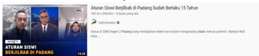
Gambar 2. Thumbnail Berita Metro TV “Aturan Siswi Berjilbab di Padang Sudah Berlaku 15 Tahun”

Thumbnail yang ditampilkan Metro TV menunjukkan kedua narasumber yang dihadirkan untuk menjawab persoalan aturan siswi berjilbab di Padang. Yaitu mantan Walikota Padang, Fauzi Bahar dan Ketua Komisi 10 DPR-RI Syaiful Huda.