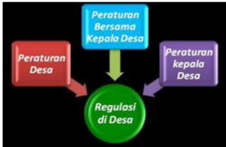
Gambar 1. Regulasi di Desa

Peraturan desa adalah peraturan perundang-undangan yang ditetapkan oleh kepala desa setelah dibahas dan disepakati bersama BPD (Undang-Undang RI No. 6 Tahun 2014 Tentang Desa bab I, pasal I ayat 7). Peraturan desa dibentuk dalam rangka penyelenggaraan pemerintahan desa dengan demikian maka pemerintahan desa harus merupakan penjabaran lebih lanjut dari peraturan perUndang-Undangan yang lebih tinggi dan tidak boleh bertentangan dengan kepentingan umum. Dan atau peraturan perUndang-Undangan yang lebih tinggi serta harus memperhatikan kondisi sosial budaya masyarakat desa setempat dalam upaya mencapai tujuan pemerintahan, pembangunan dan pelayanan masyarakat jangka panjang, menengah dan jangka pendek.